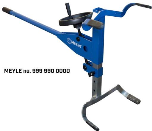
MEYLE no. 999 990 0000

Návod k montáži a použití zařízení pro kontrolu vůle v kloubech